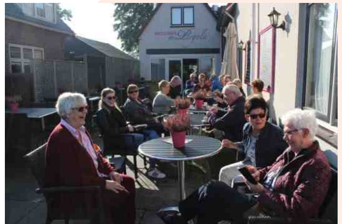
Heerlijk weer tijdens respijtweekend 2017