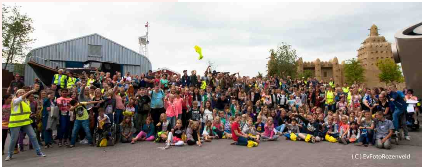
Jonge mantelzorgers uit heel Drenthe een dagje uit naar WILDLANDS Adventure Zoo Emmen.

De training is kosteloos. Opgeven kan bij Maatschappelijk Welzijn Coevorden. Telefoonnummer: 085- 2735256. E-mail: info@mwcoevorden.nl .